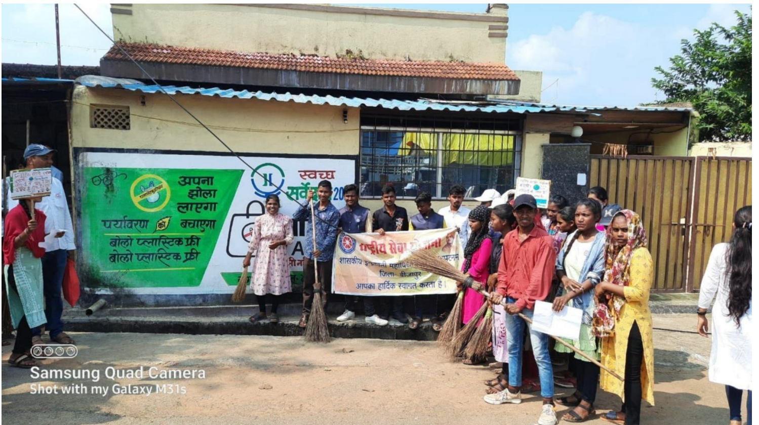
Samsung Quad Camera Shot with my Galaxy M31s